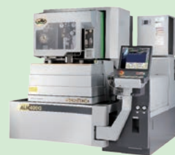
リニアモーター駆動 高速・高性能 ワイヤ放電加工機