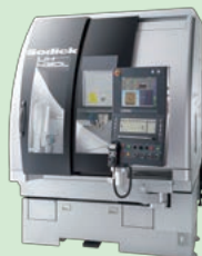
リニアモーター駆動 ウルトラハイスピード ミーリングセンター