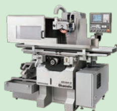
汎用機と同じように使える CNC精密成形研削盤