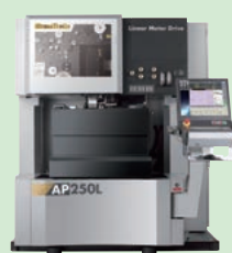
リニアモーター駆動 超精密 ワイヤ放電加工機