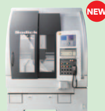
リニアモータ駆動 ウルトラハイスピードミールングセンタ