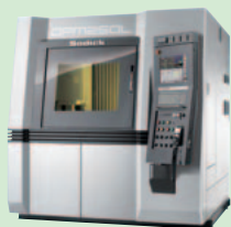
金属3Dプリンタ リニアモータ駆動 ワンプロセスミールングセンタ