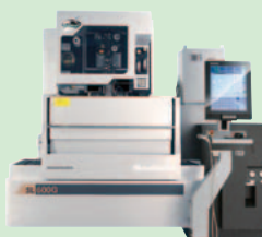
リニアモータ駆動 高速ワイヤ放電加工機