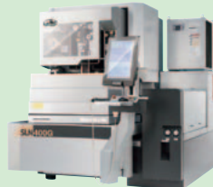
リニアモータ駆動 高速・高性能 ワイヤ放電加工機