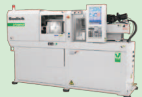
V-LINE® 小物精密部品専用 高応答射出成形機