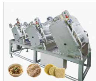
製麺機 [主要用途] 生麺、茹麺、蒸麺、冷凍麺、調理麺、乾麺、餃子皮、パスタ等