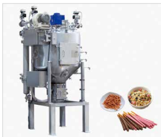
製菓関連装置 [主要用途] フライ麺スナック菓子、プレッツェル菓子、グラノーラ等