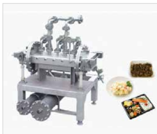
惣菜殺菌 関連装置 [主要用途] 弁当、ポテトサラダ、漬物、リング等