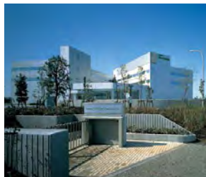
■ 本社／技術・研修センター