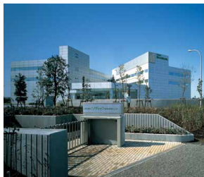
■ 本社 / 技術・研修センター